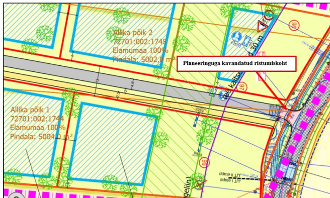
Joonis 2. Väljavõtte planeeringust

Arvestades eeltoodut ja võttes aluseks ehitusseadustiku (edaspidi EhS ) ja planeerimisseaduse (edaspidi PlanS ) ning majandus- ja taristuministri 05.08.2015 määruse nr 106 „ Tee projekteerimise normid “ (edaspidi normid ) esitame seisukohad planeeringu koostamiseks järgnevalt.